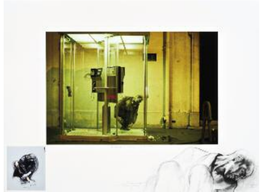
E. Pignon-Ernest, Derrière la vitre , 1996, dessins et photographie, Courtesy Galerie Lelong, © ADAGP Paris 2012.