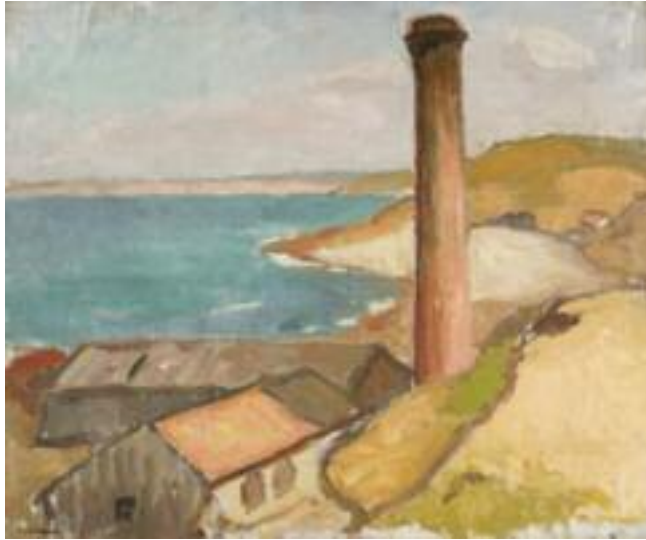
Albert Marquet, Chemin à la Percailerie , 1901, huile sur toile, 46,3 x 55,3 cm, Inv. 65.2.1 coll. Musée des Beaux-Arts de Caen.