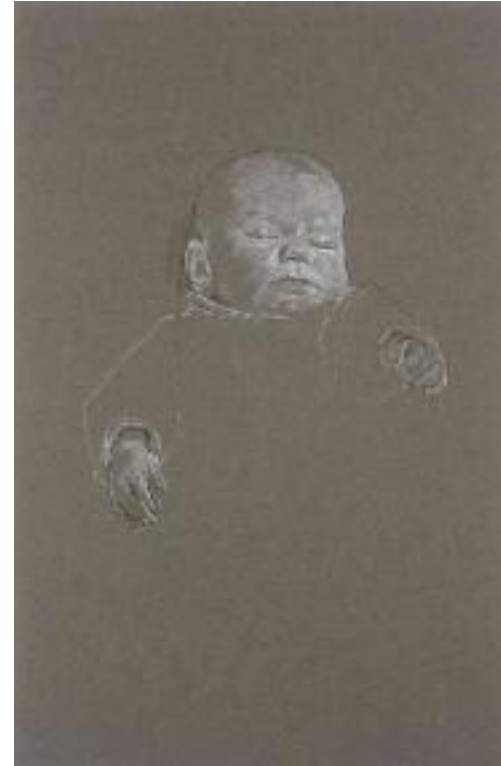
Sans titre , 1998, dessin, 50 x 33 cm, collection particulière, © ADAGP Paris 2012.