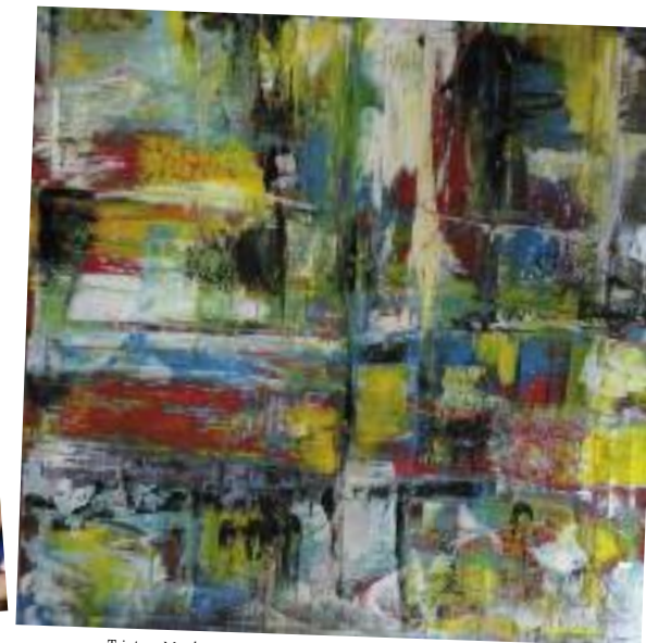
Tristan Morlet, Sans titre , 2010, huile sur toile, 100 x 100 cm, œuvre en dépôt à l'Artothèque.

Activités d'arts plastiques les mercredis et les samedis à 14h30. Sur réservation.