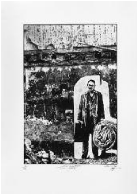
E. Pignon-Ernest, Les Expulsés II (1977), 2002, lithographie, éd. 50 exemplaires, 60 x 40 cm, Courtesy Galerie Lelong, © ADAGP Paris 2012.