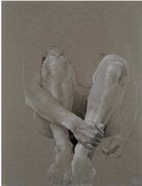
Sans titre , 1998, dessin, 65 x 50 cm, collection particulière, © ADAGP Paris 2012.