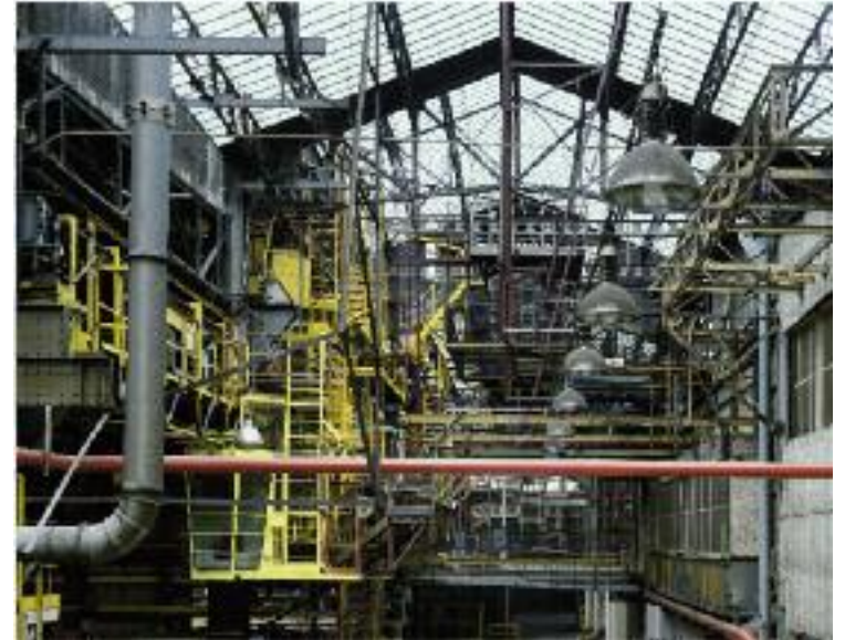
Portfolio Renault Billancourt 1, 1993, photographie, /© Stéphane Couturier/Ville Ouverte Portfolio édité en 2008, Courtesy Editions Ville Ouverte.

Exposition réalisée en partenariat avec Les Douches La Galerie www.lesdoucheslagalerie.com